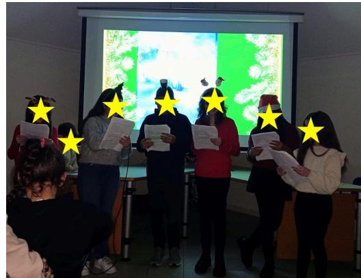
Le classi prime protagoniste della serata